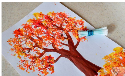
Рисование ватными палочками