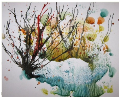
Кляксография и Выдувание из трубочки