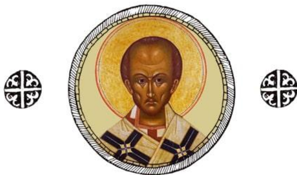
Святитель Иоанн Златоуст

Родители и воспитатели! Остерегайте детей своих со всею заботливостию от капризов пред вами, иначе дети скоро забудут цену вашей любви, заразят свое сердце злобою, рано потеряют святую, искреннюю, горячую любовь сердца, а по достижении совершенного возраста горько будут жаловаться на то, что в юности слишком много лелеяли их, потворствовали капризам их сердца. Каприз — зародыш сердечной порчи, ржа сердца, моль любви, семя злобы, мерзость Господу.