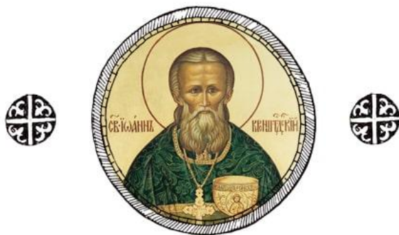
Святой праведный Иоанн Кронштадтский

своеволие, развращение и явную погубь приводит юных, от природы ко злу всякому склонных; другая огорчение, раздражение и уныние в них соделывает. Везде, ибо умеренность и средний путь похваляется. Сего ради родителям благочестивым среднего пути держаться должно.