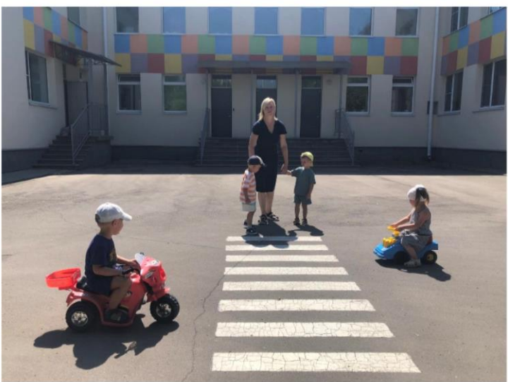
Инсценировки дорожных ситуаций