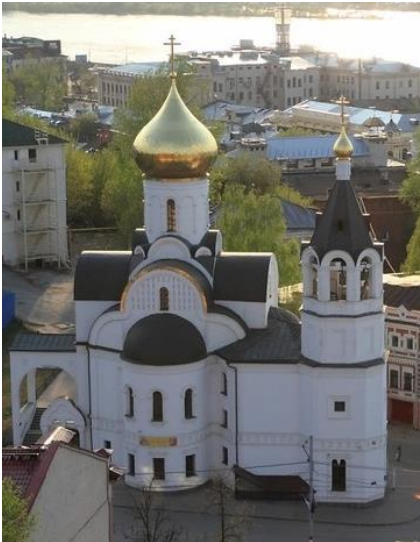
Храм в честь Казанской иконы Божией Матери в Нижнем Новгороде