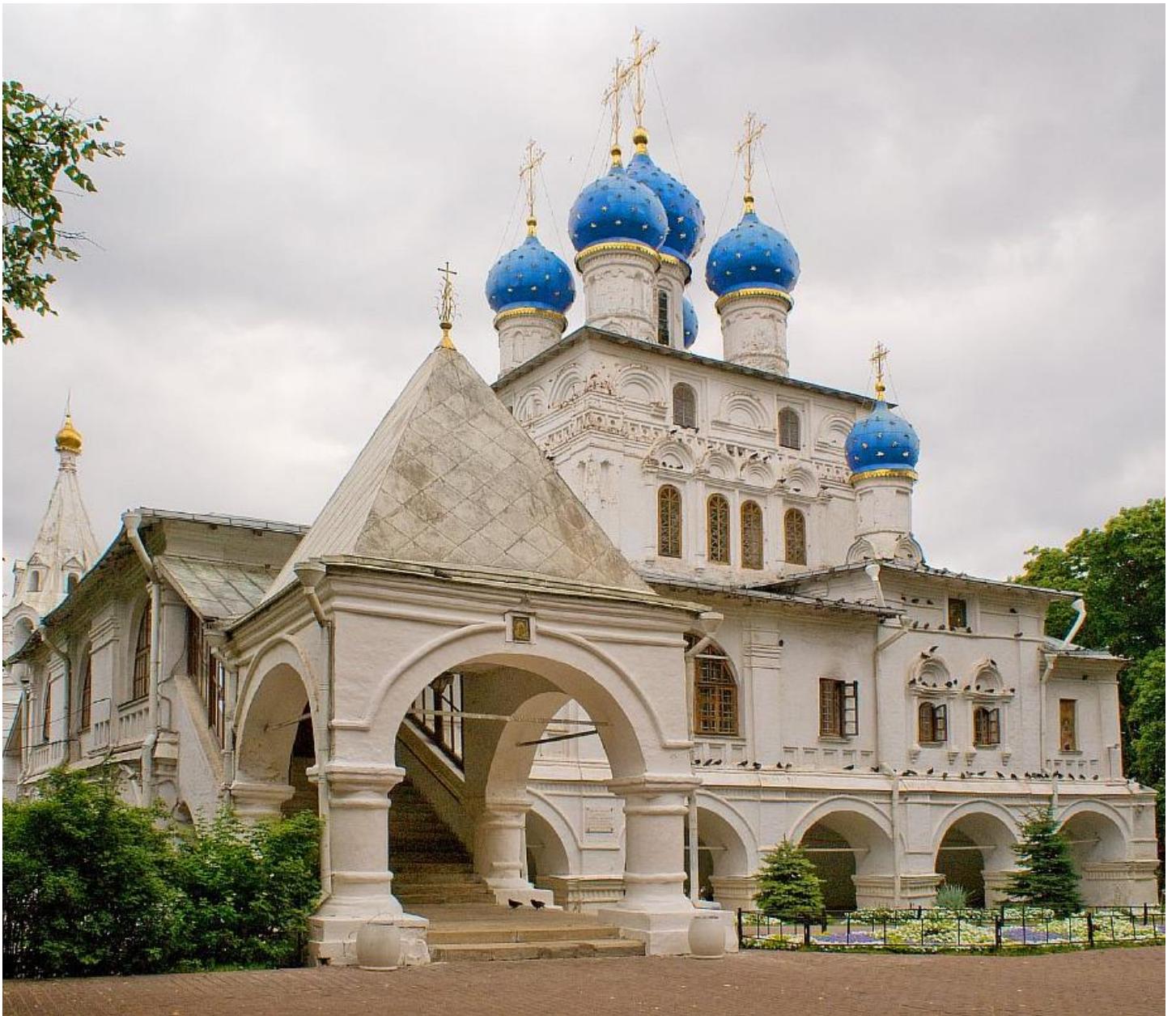
Храм Казанской иконы Божией Матери в Коломенском, Москва