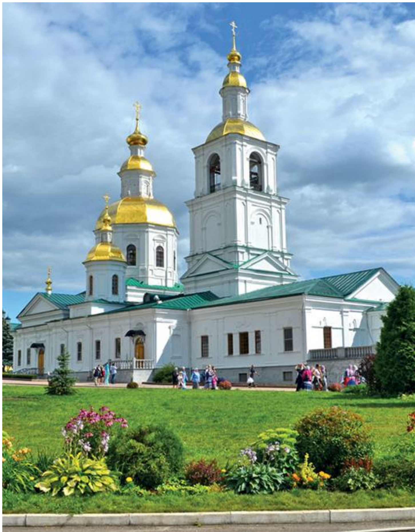
Казанский собор Дивеевского монастыря Нижегородская область