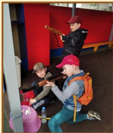
С/р игра «Мы солдаты»