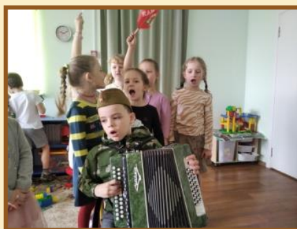
С/р игра «На праздничном концерте»