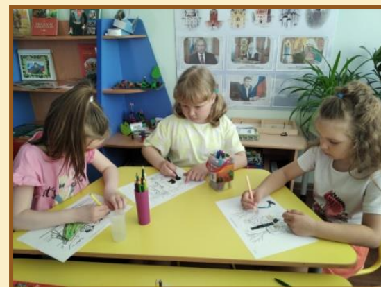
Рисование «Победа за нами»