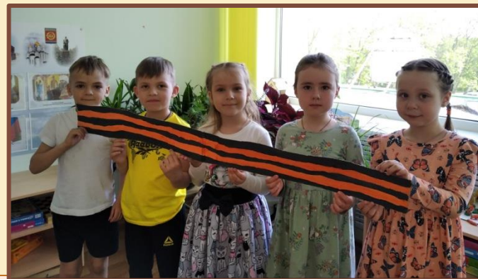
Раскрашивание георгиевской ленты для оформления выставки «Стена Памяти»