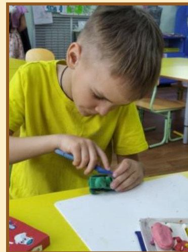
Лепка «Военная техника»